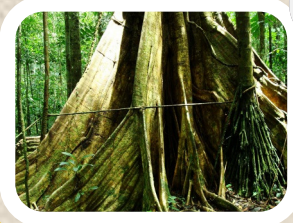
Bomen in het Amazonewoud