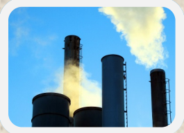
CO 2 -uitstoot