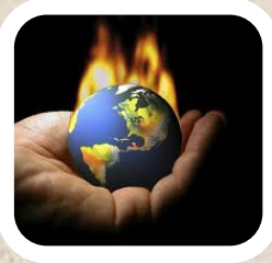
Opwarming van de aarde